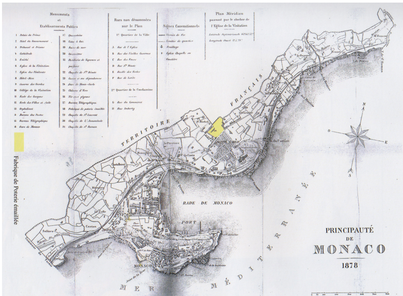
Première Poterie Artistique de Monte-Carlo, Annuaire de la Principauté de Monaco de 1878 à 1893.