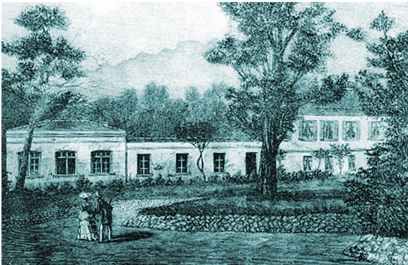
Première Poterie Artistique de Monte-Carlo.