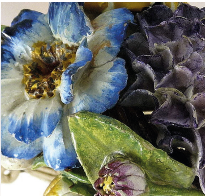
Mousquetaire Porthos, Etablissements Kérina - Monaco 1960/Corbeille à grandes anses, 1ère Poterie Artistique de Monte-Carlo Fin 19e

PLATEFORME DES ARTS VISUELS DU LOGOSCOPE