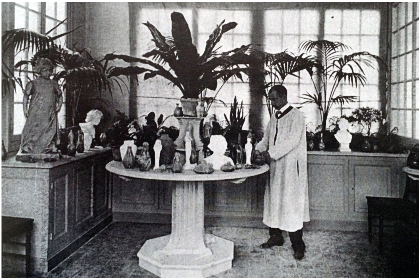
Deuxième Poterie Artistique de Monte-Carlo, extrait "Revue de la Riviera Illustrée" du 17 mars 1907